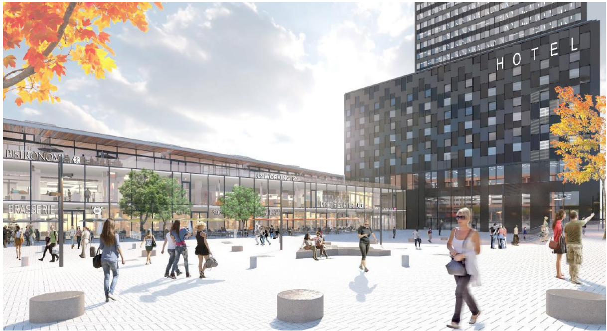
Perspective de la gare côté Galerie Béraudier – Parvis Quartier Part Dieu